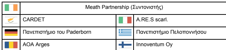
Πίνακας 1: Κοινοπραξία Εταίρων SYNERGY

Το πρόγραμμα SYNERGY ξεκίνησε το Σεπτέμβριο του 2014 υποστηριζόμενο από την Leargas, την Εθνική Υπηρεσία της Ιρλανδίας, και χρηματοδότηση από το πρόγραμμα Erasmus +. Έχει προωθηθεί από μια κοινοπραξία επτά οργανισμών από όλη την Ευρώπη, και συγκεκριμένα από την Ιρλανδία, την Ιταλία, τη Ρουμανία, την Κύπρο, την Ελλάδα, την Γερμανία και τη Φινλανδία.